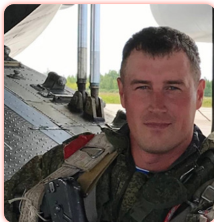
ХРОНИКА ИСТИННОГО ГЕРОИЗМА

Путь от комвзвода до начальника Штаба самоходного артиллерийского дивизиона 217 парашютно-десантного полка 98 дивизии