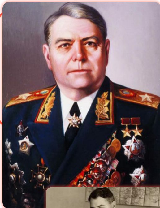
МАРШАЛ ВАСИЛЕВСКИЙ АЛЕКСАНДР МИХАЙЛОВИЧ

дважды кавалер ордена «Победа» и дважды Герой Советского Союза